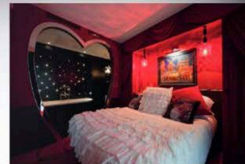
Clin d'oeil aux amoureux, dans la suite Cabaret de l'hôtel parisien Le Pradey l'entrée dans la salle de bain se fait par un coeur géant en alcôve.