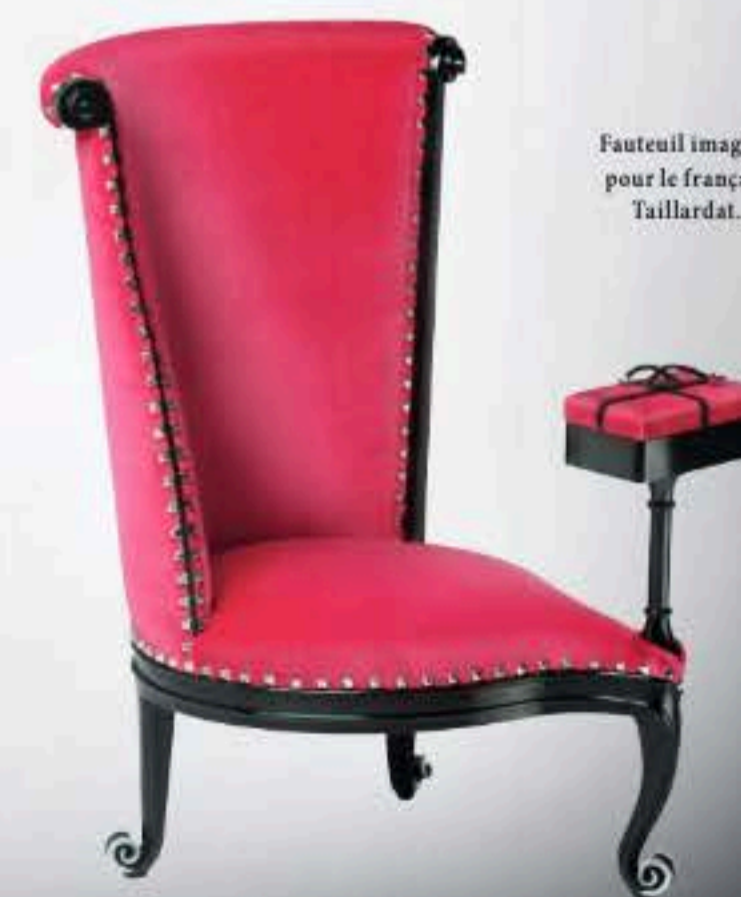
Fauteuil imaginé pour le français Taillardat.