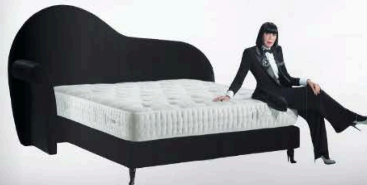
A noter sur le lit style "Méridienne" pour Treca, les pieds de lit "Coquine Bottine", adaptable aux différents exemplaires.