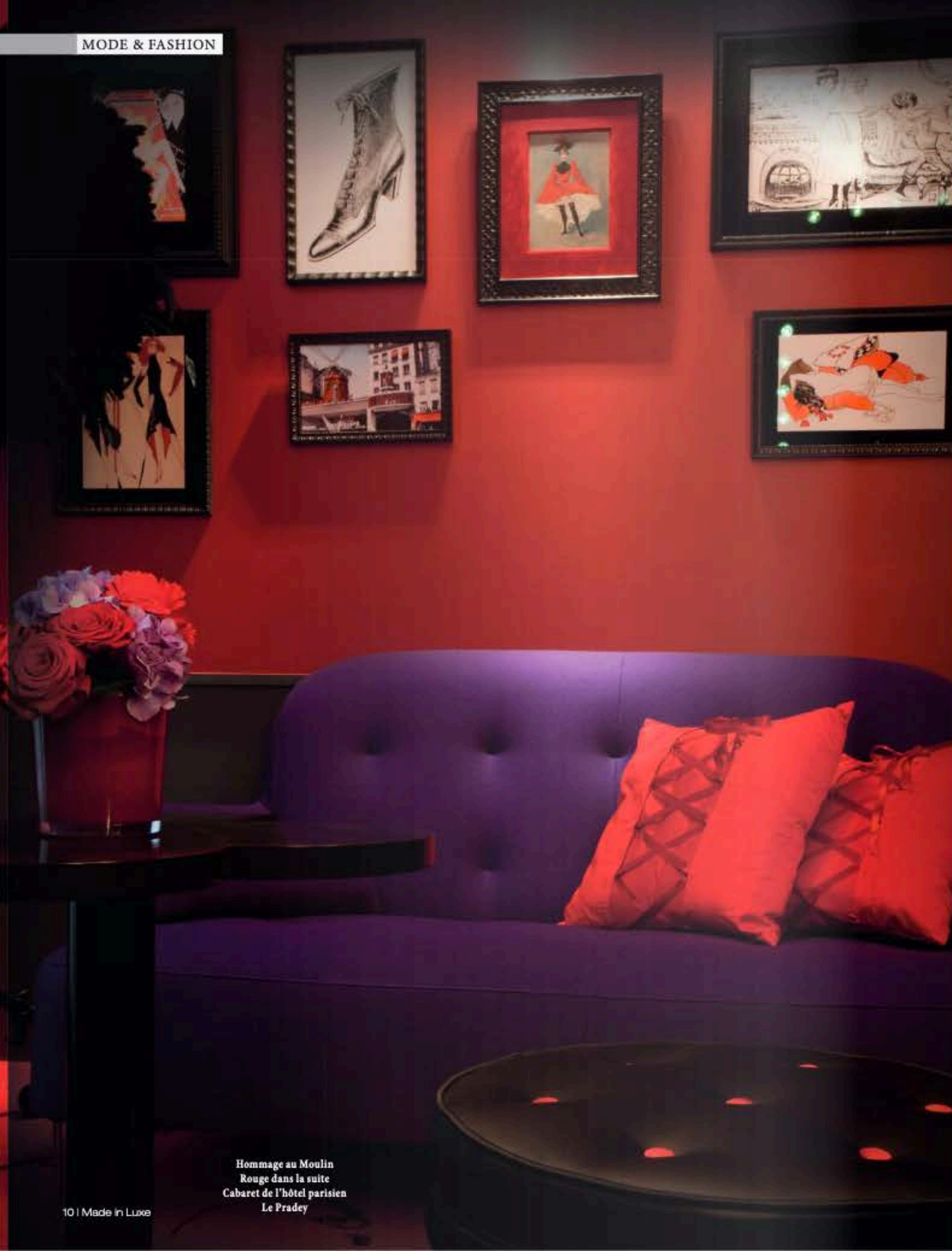
Hommage au Moulin Rouge dans la suite Cabaret de l'hôtel parisien Le Pradey