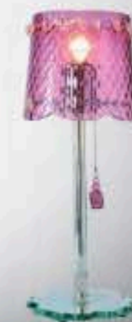
Ci-dessus et ci-contre lampe dessinée par Chantal Thomass pour Veronice

Toujours aussi séillante, la sexagénaire qui habilla Brigitte Bardot à ses débuts a décidé de partager son carnet d'adresses, de Paris à New-York en passant par Venise et Tokyo (Editions Chêne). De quoi tester les meilleurs endroits pour un dîner gourmand, céder à une folie de shopping ou encore prendre le temps de se reposer et de prendre soin de soi. Le guide réunissant 240 adresses sous forme d'Abécédaire (A comme ... Accessoires, H comme ... Hommes, T comme ... Talons aiguilles) est également disponible dans une boîte abritant des cartes de correspondance délicatement illustrées avec leurs enveloppes et un carnet de notes en forme de bustier. De quoi célébrer la Saint-Valentin toute l'année!